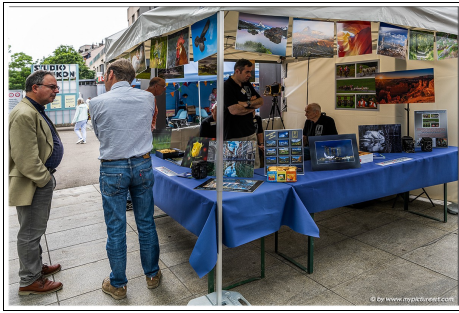
Interessante Gesprächen mit Besuchern