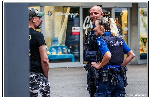
Für Sicherheit war auch gesorgt