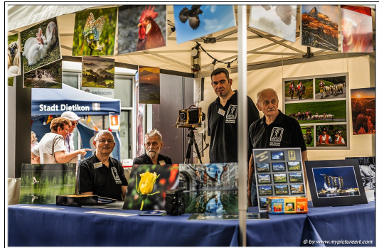
Danke den unermüdlichen Standbetreuern