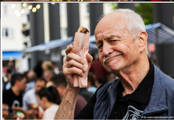
Der Hunger musste auch mal gestillt werden