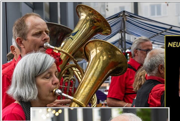
Die Musik war gleich neben unserem Stand